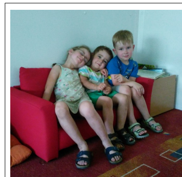
Die neue Kindercouch ist super!

Viele weitere Projekte für die Kinder können wir uns vorstellen!